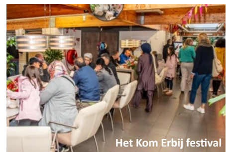
Het Kom Erbij festival